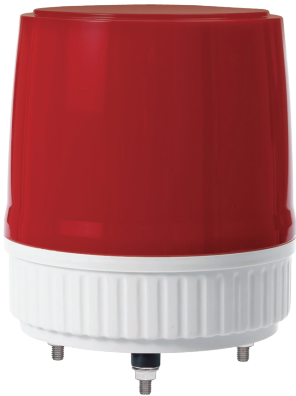
S180US / S180UHS