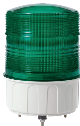
S150UL / S150US