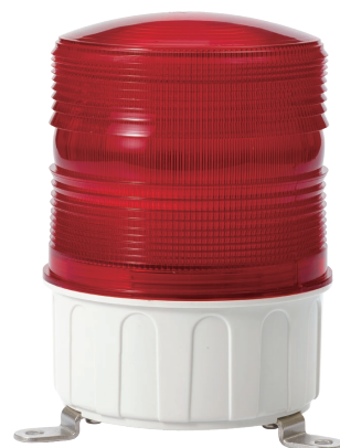
S150UL-FT / S150US-FT