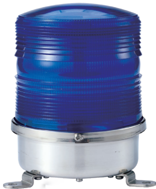
S150RL-FT / S150RS-FT