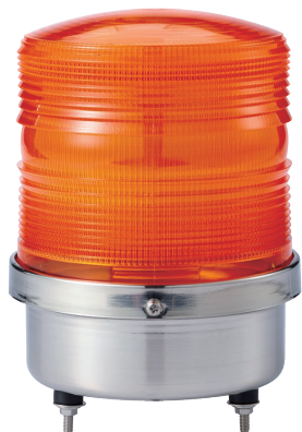
S150RL / S150RS