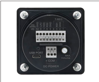
电源和CAN通讯电缆线接线端子 (背面)