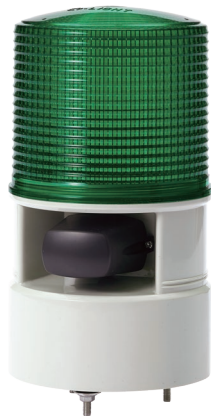
S125DL / S125DS